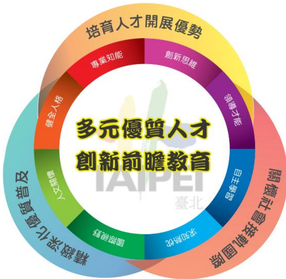
圖 1 臺北市資優教育推動願景

本市推動資優教育基於前述理念，以培育兼具「專業知能、創新思維、領導才能、自主學習、求知熱忱、國際視野、人文關懷及健全人格」等能力及特質之多元領域優質人才為推動核心，期藉各項行動方案及全面性、多元推動方式，使本市具多元發展潛能之資優學生均能獲得適性教育機會與服務，以達到本市「多元優質人才 創新前瞻教育」之資優教育推動願景（如圖 1），進而提升國家競爭力，其推動架構，如表 1。