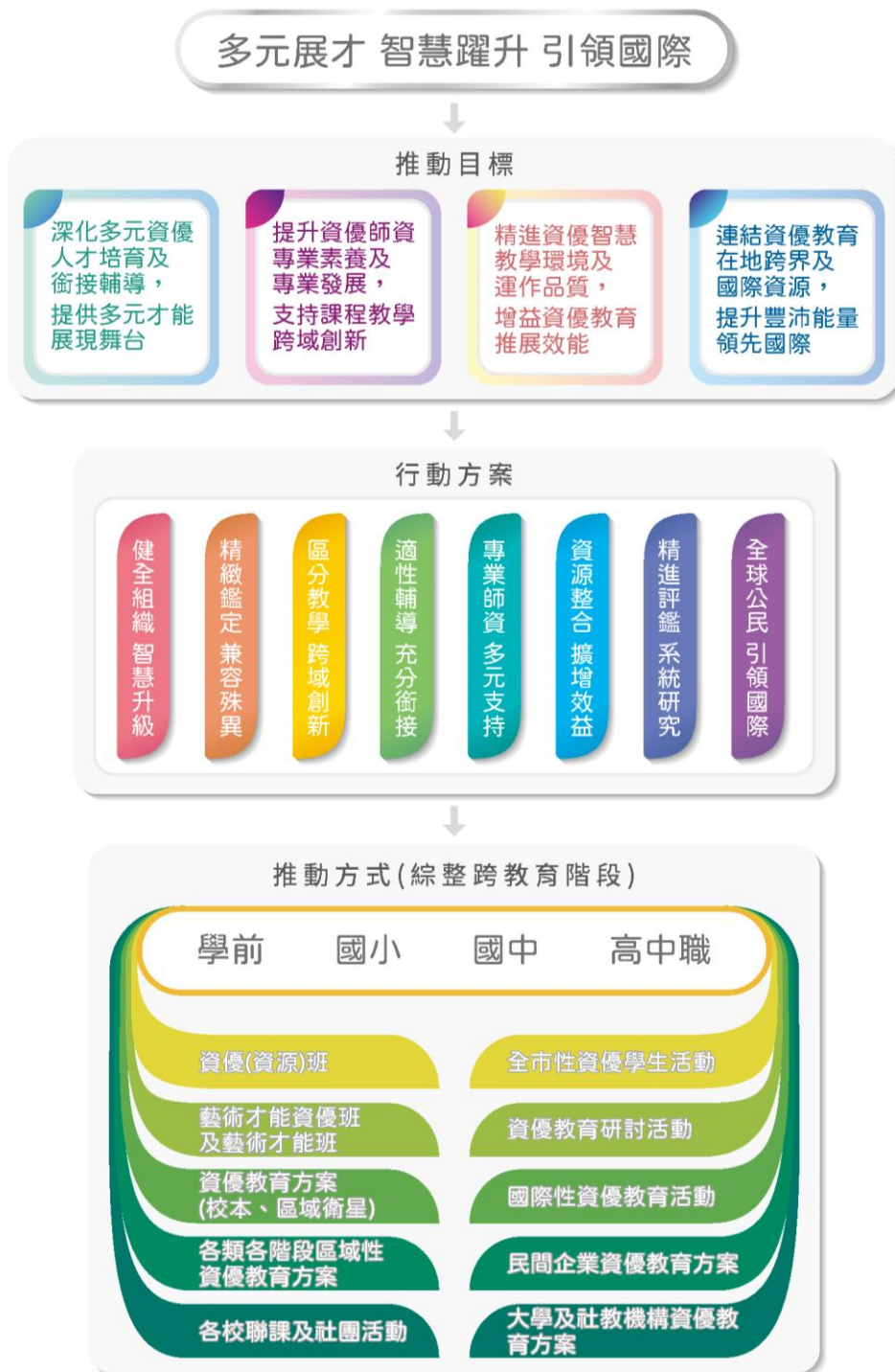
圖 2 臺北市資賦優異教育白皮書—中長程發展計畫（2021-2026）推動架構